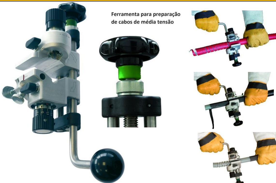
Ferramenta para preparação de cabos de média tensão