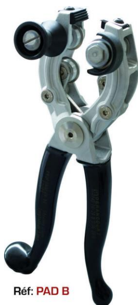
Réf: PAD B